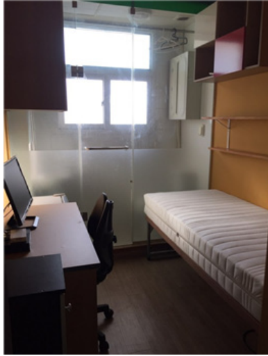
방 내부 구조