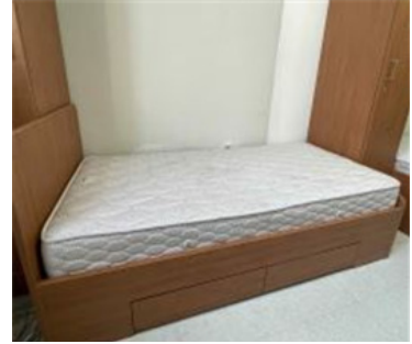
방 내부 구조