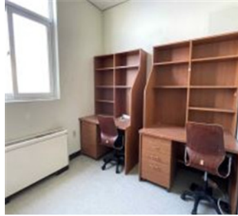
방 내부 구조