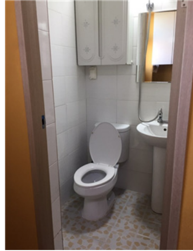
방 내부 화장실