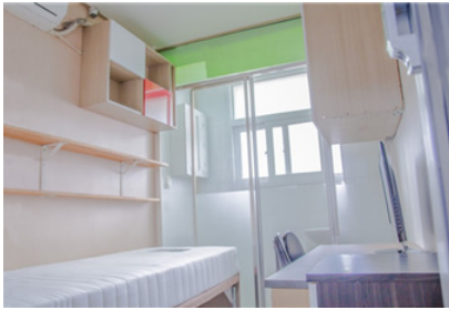
방 내부 구조