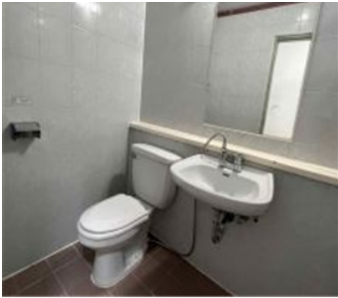
방 내부 화장실