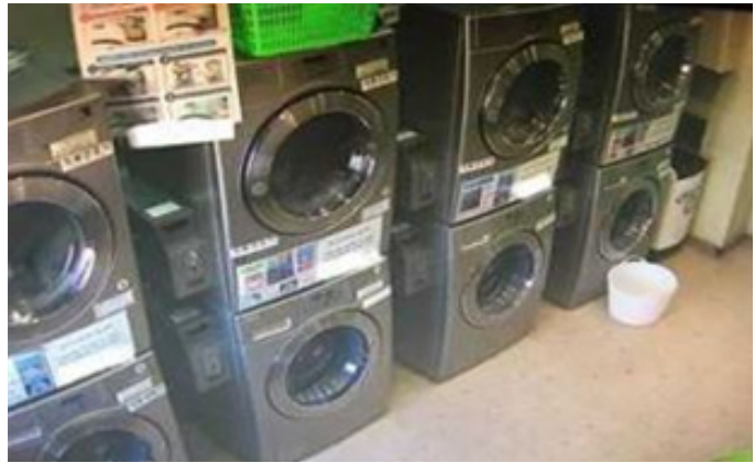
공동 코인 세탁실